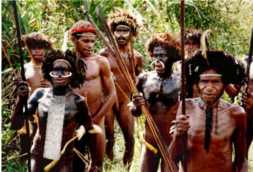
Papoea's Nieuw Guineea

waren. De ziekte openbaarde zich vooral in bewegingsafwijkingen en tremor na een incubatietijd van vaak tientallen jaren, vandaar dat er nog steeds circa 10 slachtoffers per jaar vallen (Tyler, 1998).