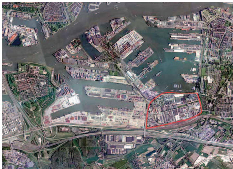
De Waalhaven met bedrijventerrein Waalhaven-Zuid

Superhub en kraamkamer Het Waalhaven-Zuid gebied heeft relaties met spoor, weg en water. Het is daarmee een echte A-locatie. Waalhaven-Zuid kan door intensivering en verhoging van efficiency uitgroeien tot een superhub, vergelijkbaar met Schiphol. Wij zetten daarom in op het ontwikkelen van een modern en hyperefficiënt distributiepark, distripark Waalhaven-Zuid. Dit distripark zal een aanzuigende werking hebben op bedrijven in de logistieke sector. En daarmee wordt de regio van Rotterdam ontzien. Met andere woorden: de ontwikkeling van Waalhaven-Zuid tot een hyperefficiënt distripark maakt het aanleggen van nieuwe bedrijventerreinen in de omgeving van Rotterdam, zoals in de Hoeksche Waard, onnodig. Veel bedrijven zijn in de Waalhavens gestart en later doorgegroeid naar grotere terreinen verderop in de havens. Dat is een kwaliteit die gehandhaafd moet blijven. Wij zien Waalhaven-Zuid als een hyperefficiënt distripark, dat tegelijkertijd een broedplaats blijft voor startende, innovatieve bedrijven. In het masterplan is daarom ruimte gemaakt voor een 'kraamkamer'.