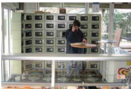
3. Snackloket Appie Happie