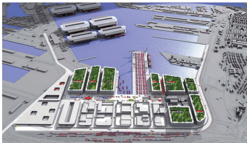
Superhub: Distripark Waalhaven-Zuid als onderdeel van één grote overslagmachine