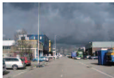
2. Van Maasdijkweg: typische straat in Waalhaven-Zuid