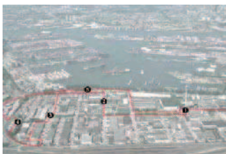
Wandeling door Waalhaven-Zuid

Analyse van een verouderd bedrijventerrein op een strategische locatie