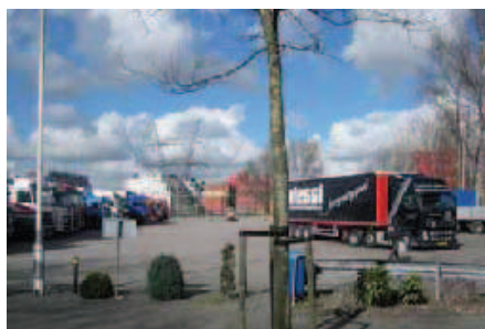
4. Truckpark Waalhaven: toevluchtsoord voor buitenlandse chauffeurs