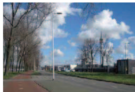
5. Waalhaven Zuidzijde: rommelige skyline

In overleg met het Havenbedrijf Rotterdam is Waalhaven-Zuid gekozen als studiegebied voor Ontwerpen aan Goederenvervoer . De Waalhaven en Eemhaven in Rotterdam-Zuid worden ook wel de stadshavens genoemd. Het zijn de oude Rotterdamse havengebieden die het dichtst tegen de stad aanliggen, daar waar de groei van Rotterdam als grootste haven ter wereld begon. Vóór de Tweede Wereldoorlog bevond zich op het huidige bedrijventerrein van Waalhaven-Zuid het eerste (inter)nationale vliegveld van Nederland. Na het bombardement is hard gewerkt aan het