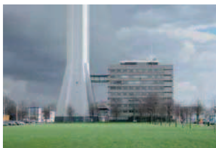
1. Zendmast en KPN-gebouw: een monument